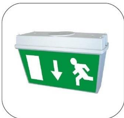
Piktogramy w zestawie

Dwustronna oprawa oświetlenia awaryjnego i ewakuacyjnego o stopniu szczelności IP65. Wykonana z poliwęglanu (PC). Przeznaczona do oświetlania wyjść i wyznaczania dróg ewakuacyjnych w budynkach użyteczności publicznej.